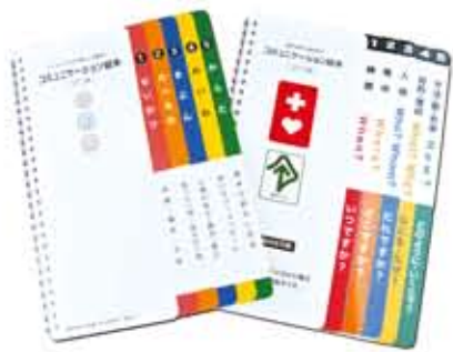
左: サポート編(旧 介護編) 右: アクティブ編